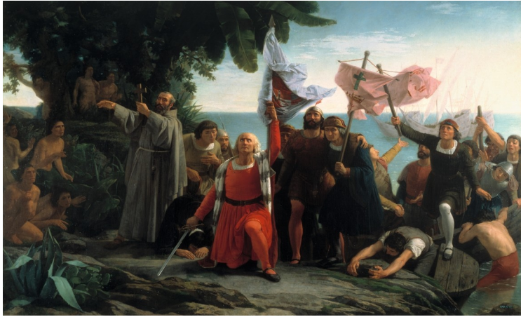
PUEBLA Y TOLÍN, DIÓSCORO TEÓFILO. 1862